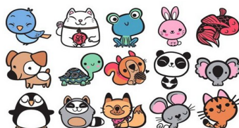
Le mouvement Kawaii

Les questions que nous nous sommes posées :