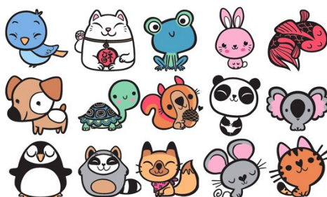
Le Mouvement Kawaii