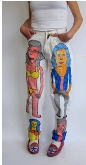
Création de Samuel Cariaux. Créahm Région wallonne.