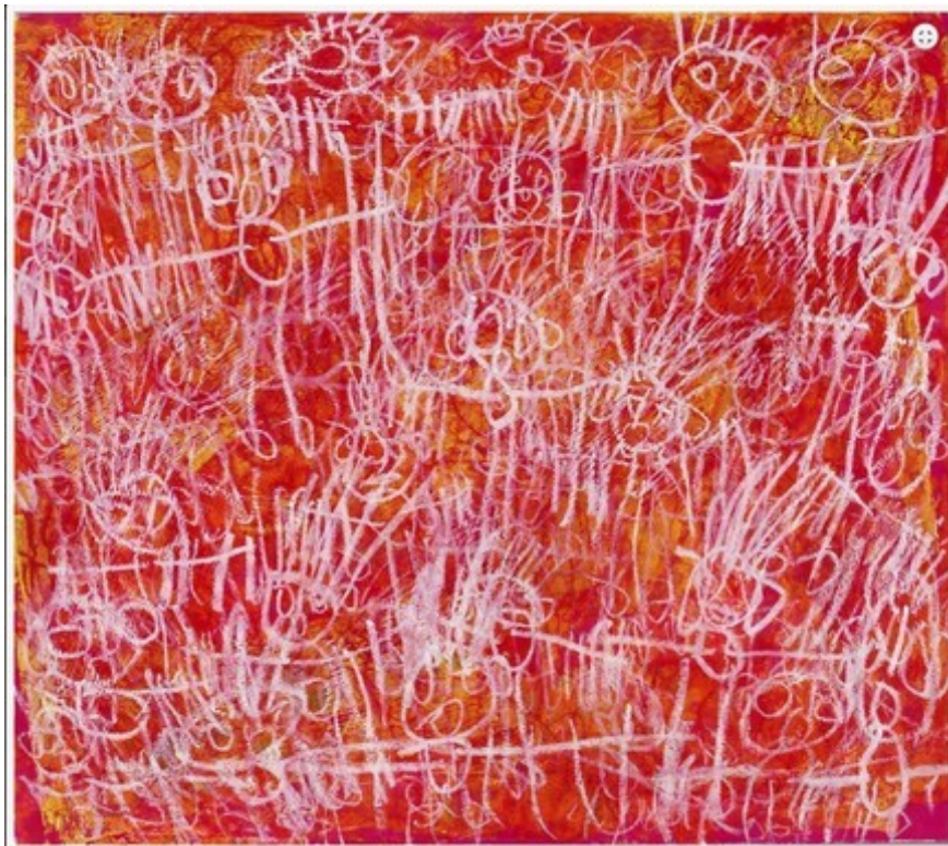
Oeuvre réalisée par un élève dans le cadre de l'Atelier Art et différences à Kain