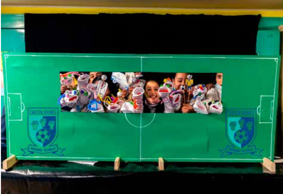
Bressoux - De Gaulle